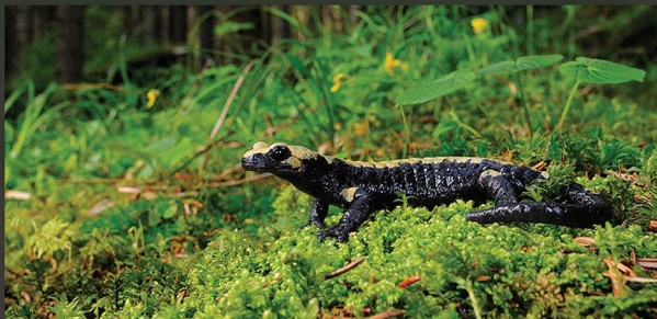
Nel 2007 la salamandra di Aurora è stata trovata anche sull'altipiano di Vezzena, prima segnalazione in provincia di Trento. In 2007, Aurora's salamander has also been discovered in the Vezzena plateau, the first record in the province of Trento.

Aurora's salamander lives only in the Sette Comuni Plateau. So far it has been found only in a few areas between Monte Fossetta (north of Gallio) and the Vezzena plateau (just over the border with Trentino region). Some forests host dense populations and are therefore strongholds for this animal, like the beech and fir forest between Bosco del Dosso and Val d'Anime, where Aurora's salamander has been discovered and studied for the first time.